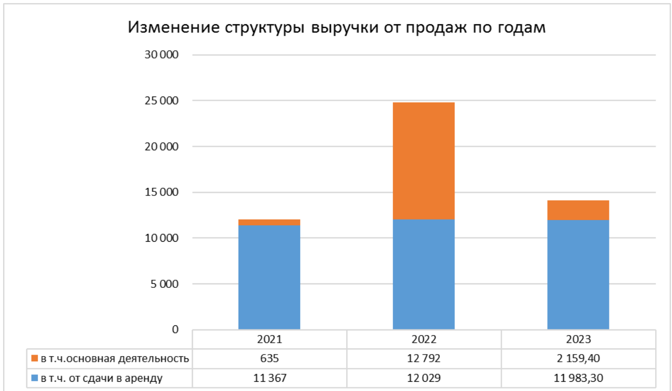
Изменение структуры выручки от продаж по годам